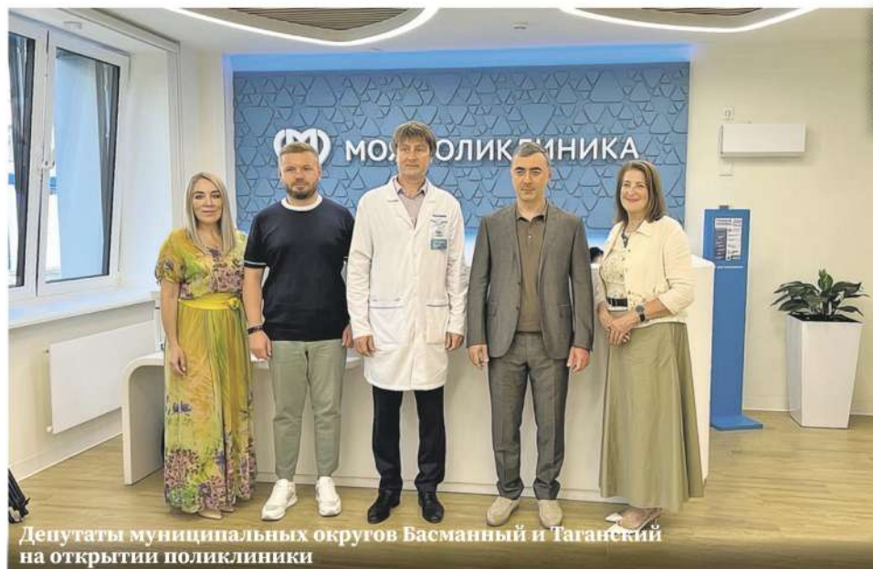
Депутаты муниципальных округов Басманный и Таганский на открытии поликлиники

Для гостей церемонии, среди которых было много жителей Басманного и Таганского районов, провели экскурсию по обновлённому стандартам медицинскому комплексу, гостей угостили кислородным коктейлем. Маленьких пациентов ждал художник по аквагриму.