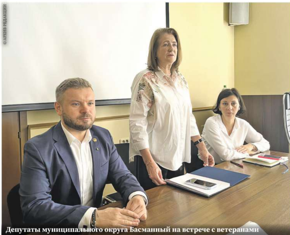
Депутаты муниципального округа Басманный на встрече с ветеранами

По всем вопросам, связанным с деятельностью Совета, можно лично обращаться в Совет ветеранов Басманного района каждый вторник с 11.00 до 15.00 по адресу: ул. Новая Басманная, д. 37, с. 1, ком. 110. Необходимо предварительно записаться по телефонам: +7 (499) 267-83-26 или +7 (499) 267-54-21.