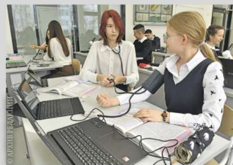
Адаптация учебных программ

В обновлённые программы по всем школьным предметам войдут элементы знакомства с будущими профессиями. Например, в медицинских классах в программу по литературе уже включаются произведения о врачах. Этот метапредметный подход позволяет дать ученикам углублённые знания по химии и биологии, освоить навыки младшей медицинской сестры и сформировать образ врача через книги, фильмы и их обсуждение на уроках.