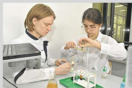
Знакомство с профессиями на предприятиях столицы

В обновлённые программы по всем школьным предметам войдут элементы знакомства с будущими профессиями. Например, в медицинских классах в программу по литературе уже включаются произведения о врачах. Этот метапредметный подход позволяет дать ученикам углублённые знания по химии и биологии, освоить навыки младшей медицинской сестры и сформировать образ врача через книги, фильмы и их обсуждение на уроках.