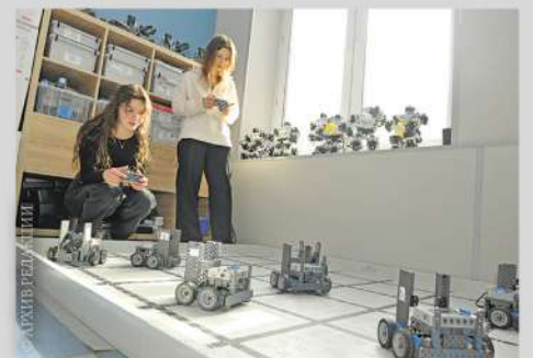
Проектная и исследовательская деятельность на базе вузов

батывать профессиональные навыки. Выпускники предпрофессиональных классов вместе с аттестатами получат свидетельства о профессии. Например, ученики инженерных классов осваивают профессию чертёжника-конструктора.