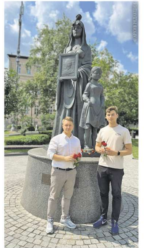
Также в июле мы вспоминаем одно из решающих сражений Великой Отечественной войны.

Ровно 80 лет назад началась Курская битва, длившаяся 50 тяжелейших дней и ночей.